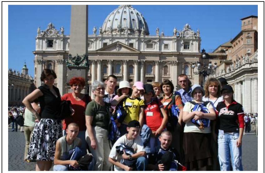
Najśłynniejszy plac na świecie – Plac Świętego Piotra. Dla nas Polaków miejsce wyjątkowe.