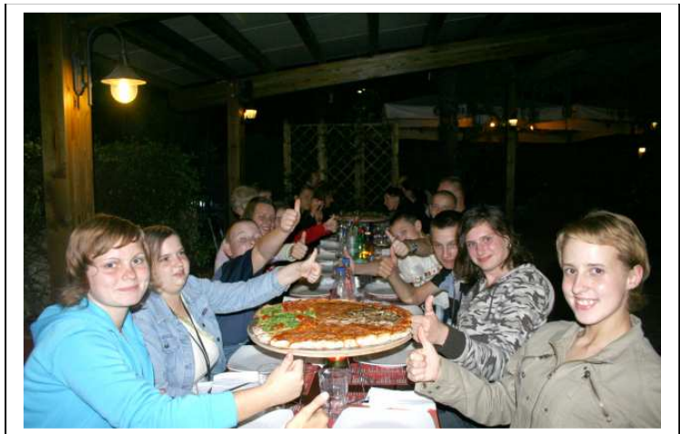
W Rzymie pizza smakuje najlepiej.