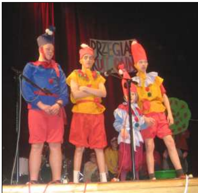
Przeгляд Kulturalny Szkół