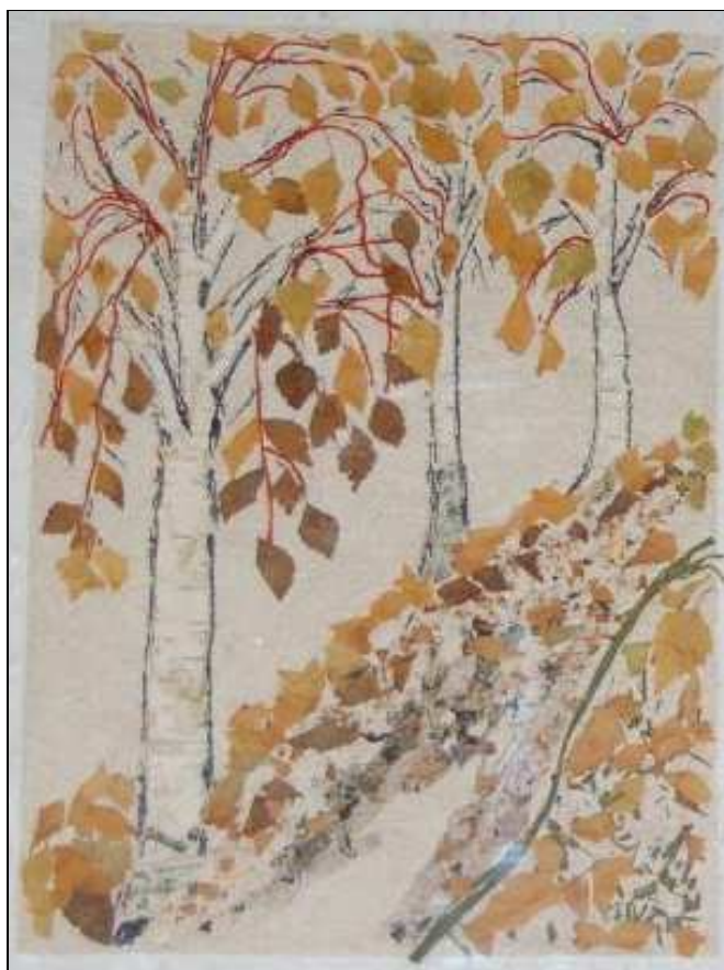
Na zdjęciu praca Małgorzaty Zapaśnik