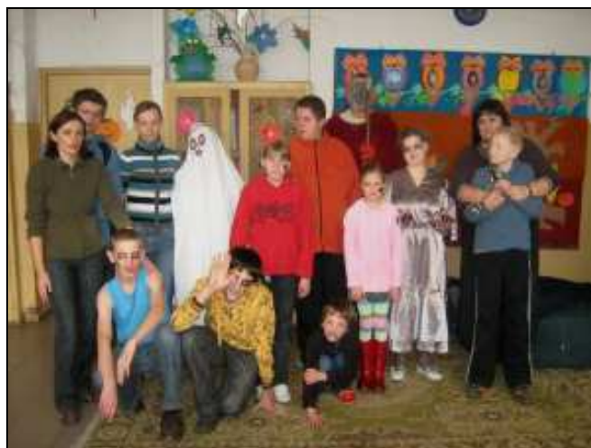
Impreza z okazji Halloween