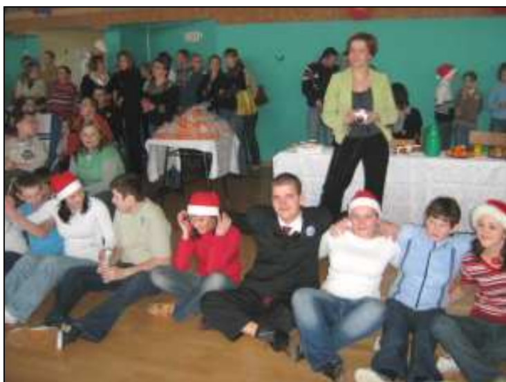
Festyn Mikołajkowy w Giżycku